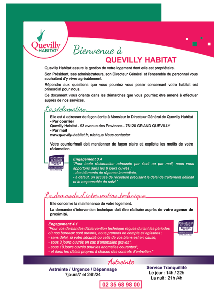
Réclamations et demandes d'interventions techniques