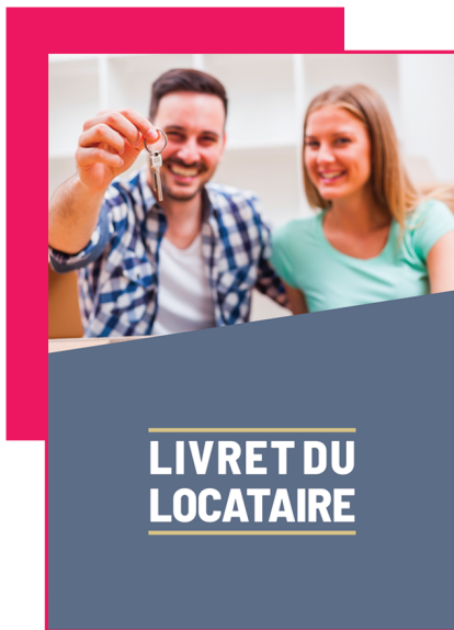
Livret du locataire